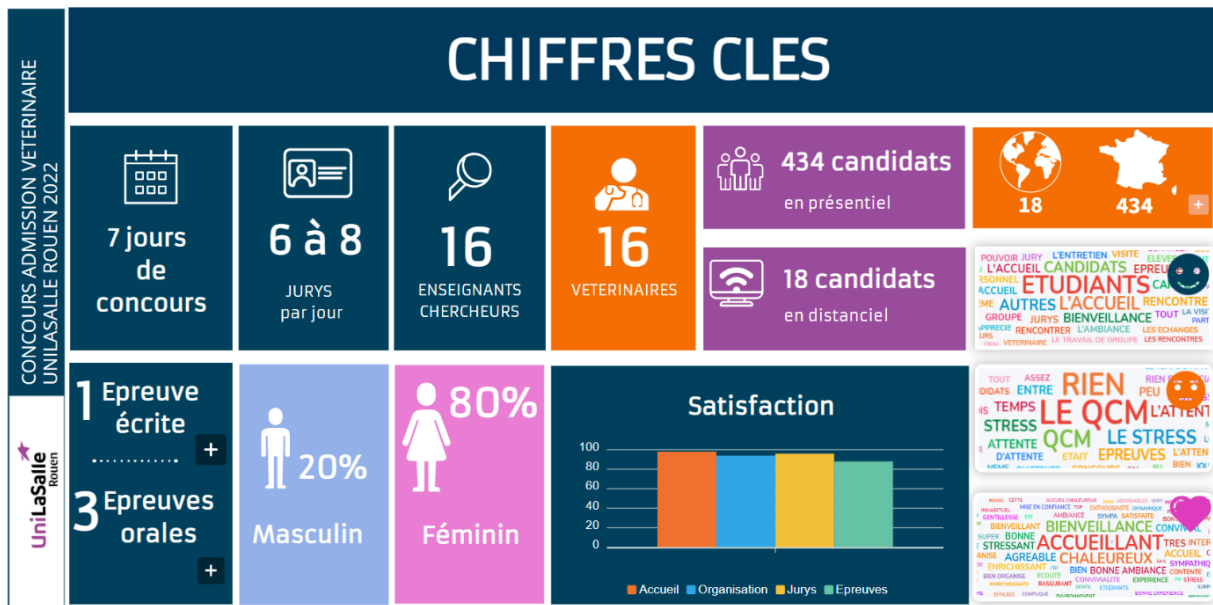
Figure 1 : Chiffres clés des épreuves d'admission à l'école vétérinaire UniLaSalle issue d'une enquête interne (taux de réponse 67%) – Session 2022