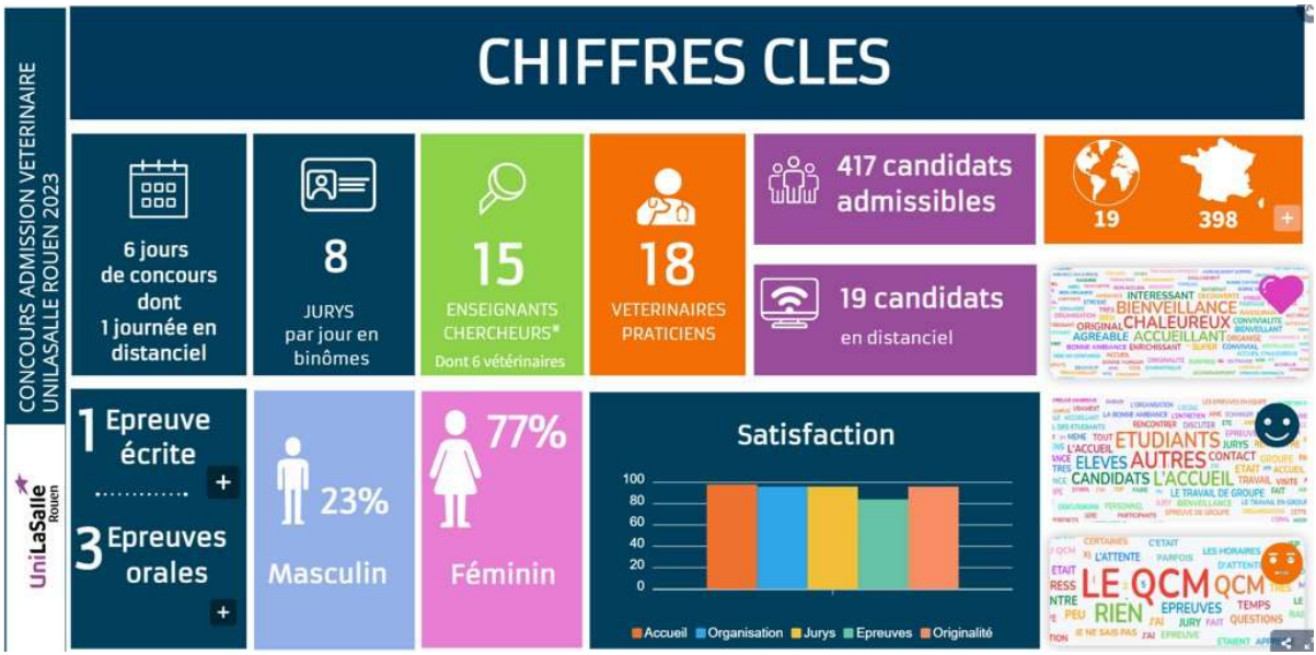
Figure 1 : Chiffres clés des épreuves d'admission à l'école vétérinaire UniLaSalle issue d'une enquête interne (taux de réponse 82%) – Session 2023